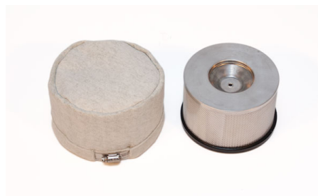
Filtre de sécurité et filtre HEPA inclus