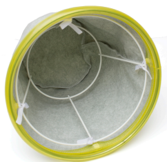
Filtre principal antistatique inclus