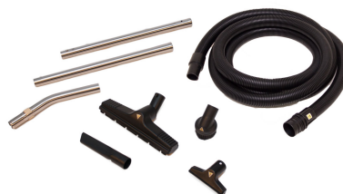
Outils et accessoires antistatiques inclus