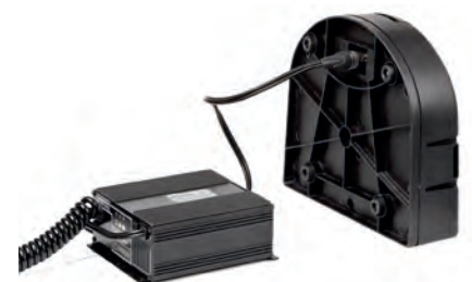
Chargeur et batterie amovible inclus