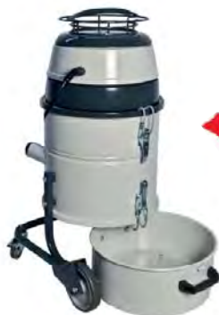
Cuve facilement décrochable

Roues de qualité industrielles dont 2 roues multidirectionnelles