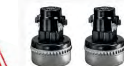
Deux moteurs by-pass monophasés

Le câble se range facilement sur la tête de l'aspirateur