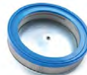
Filtration HEPA H14 disponible

Construction industrielle en acier peint epoxy