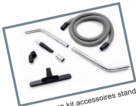
Livré avec son kit accessoires standard