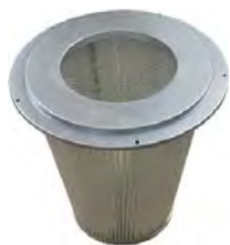
Filtration conique catégorie M 1µ Surface filtrante 30 000 cm 2

Construction industrielle en acier peint epoxy