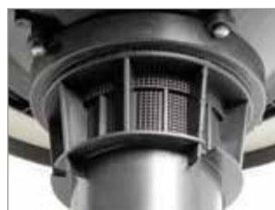
SYSTÈME ANTI-MOUSSE INTÉGRÉ