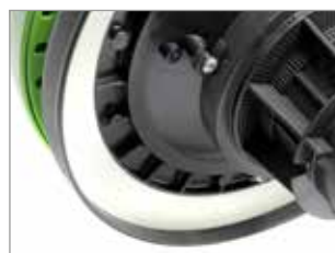
JOINT DE TÊTE NOVATEUR