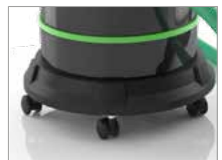
CHARIOT AVEC ROUES PIVOTANTES