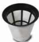
Filtre tissu KTRI03023 (3833)