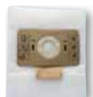
Pochette 10 sacs microfibre classe M KTRI04794 (SA 10)