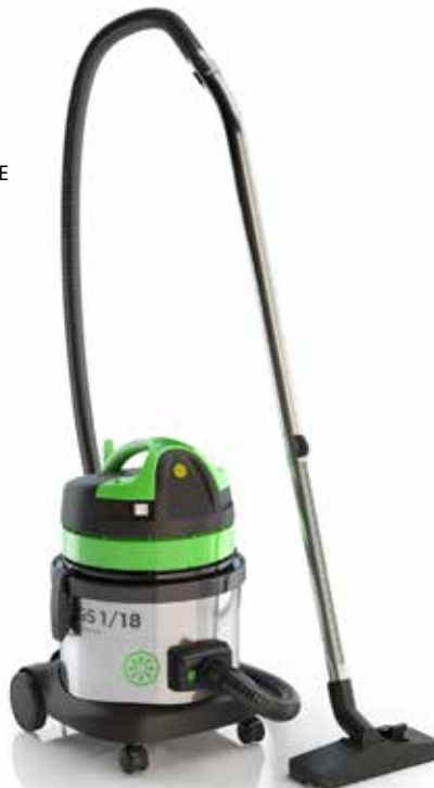
GP 1/18 ECO B