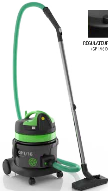
GP 1/16 ECO B LUX