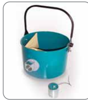
Kit optionnel avec embouchure, sac papier (10 pièces) et obturateur (code 560327)

Un bac spécifique intégrant l'embouchure, le sac papier de récupération et l'obturateur d'embouchure, est également disponible.