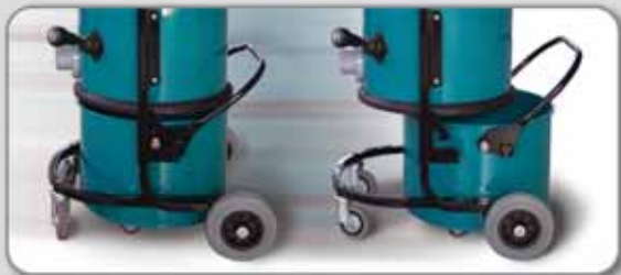
Kit d'accessoires standard code 824070